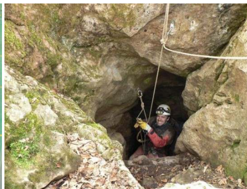
Gyakorlati barlangi oktatás kezdetei.....