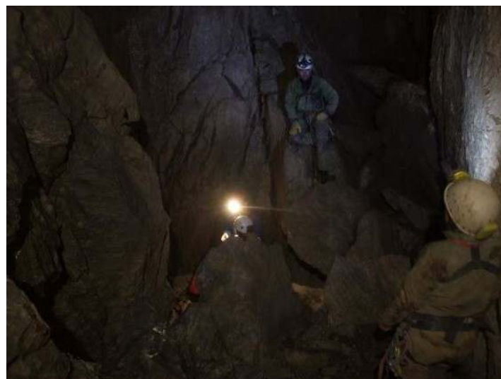
Borókás-tebri 2. sz. víznyelőbarlang, Óriás-akna