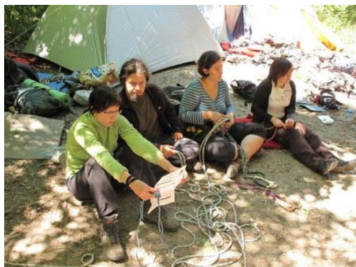
Kötéltechnikai oktatás Barlangász csomók gyakorlása