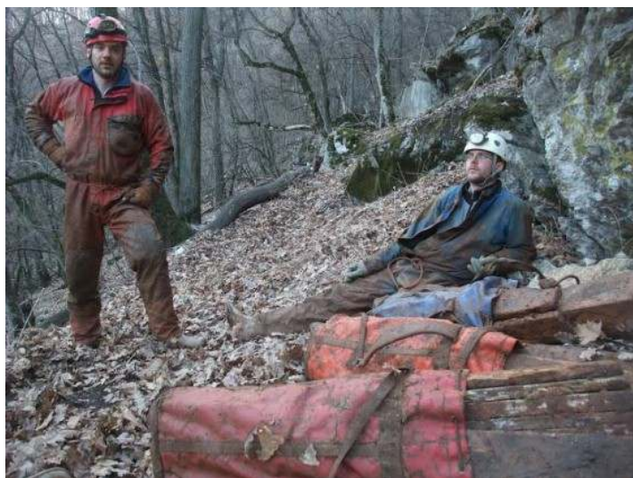
A Hajnóczy-barlang bejáratánál a kihozott faanyaggal